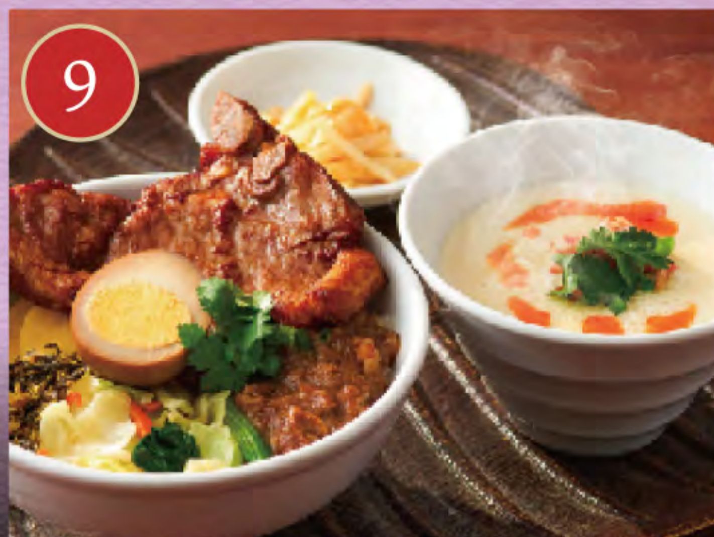
パイコー飯と鹹豆漿セット