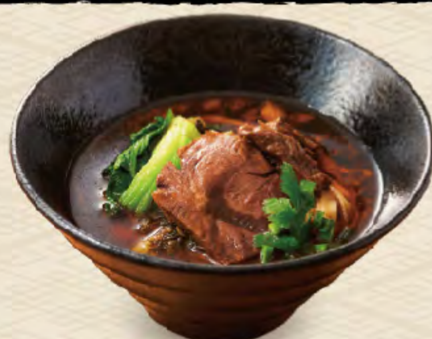
16 牛肉チャーシュー麺