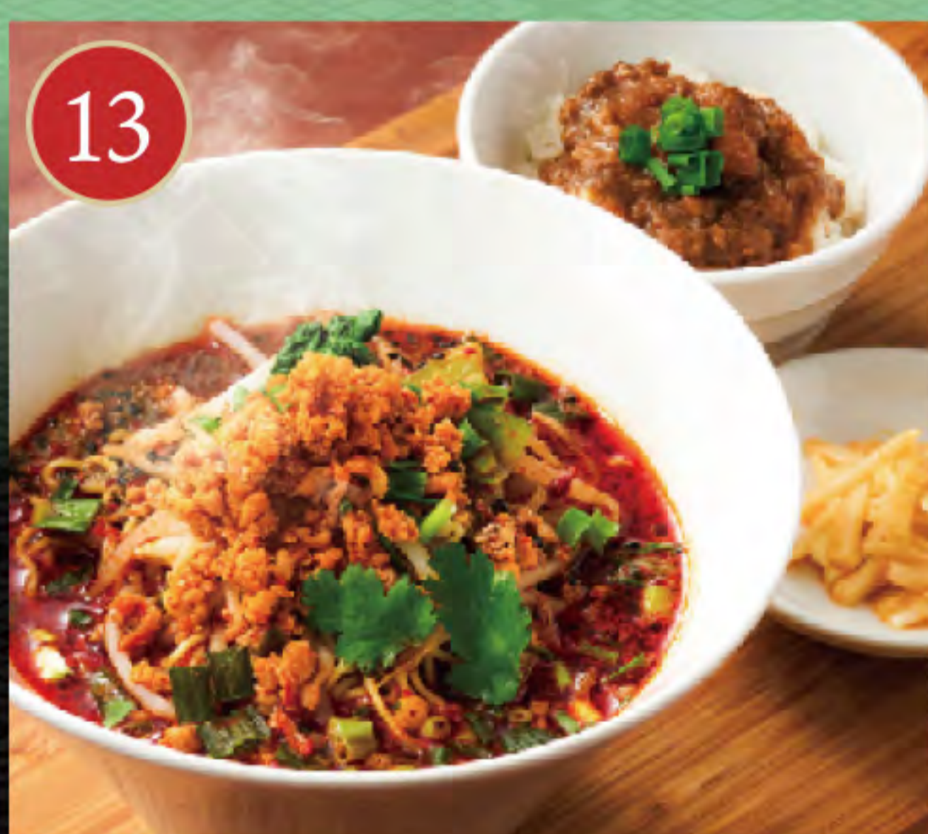
旨辛担々麺とミニ肉みそご飯セット