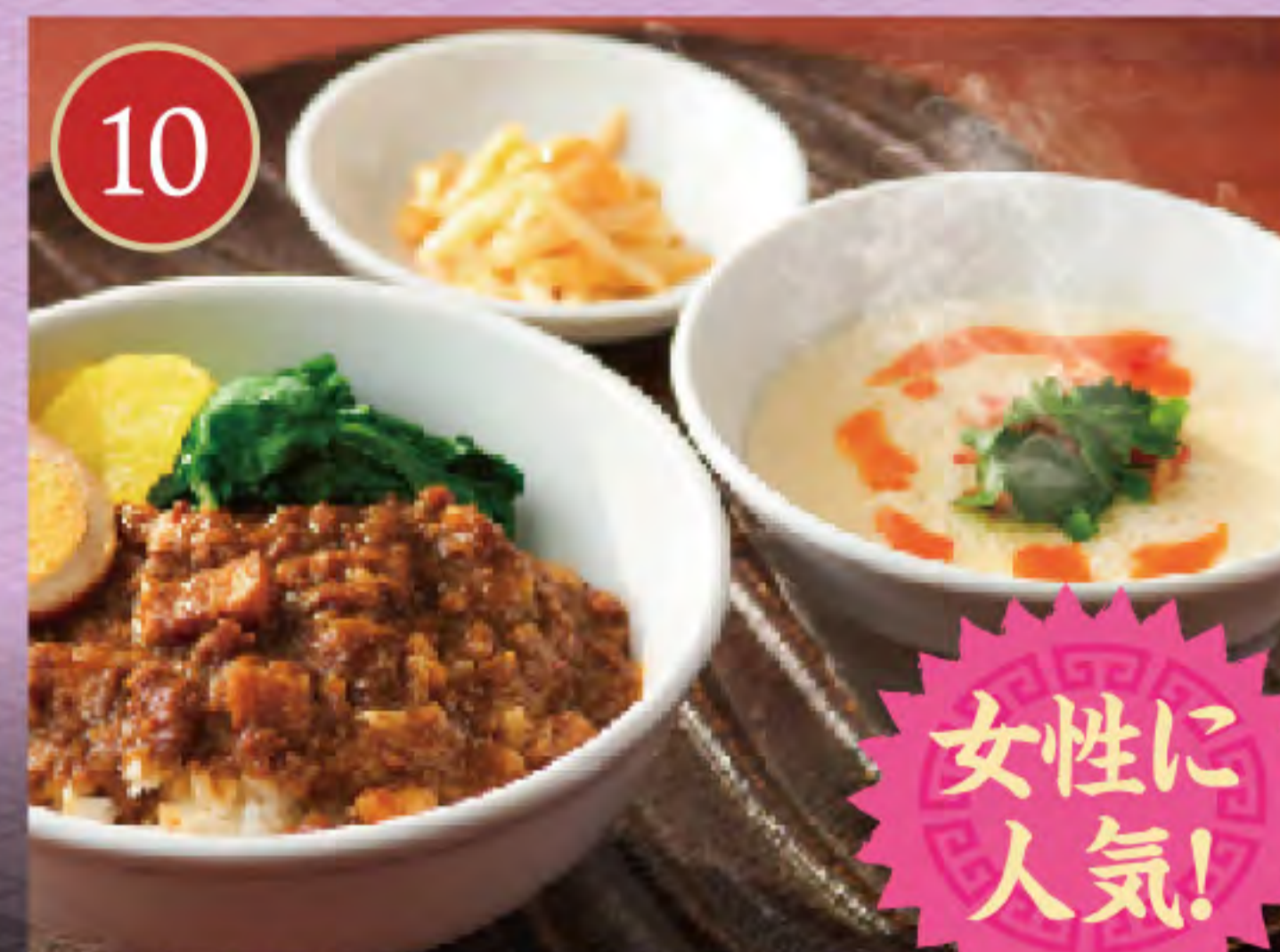
肉みそご飯と鹹豆漿セット