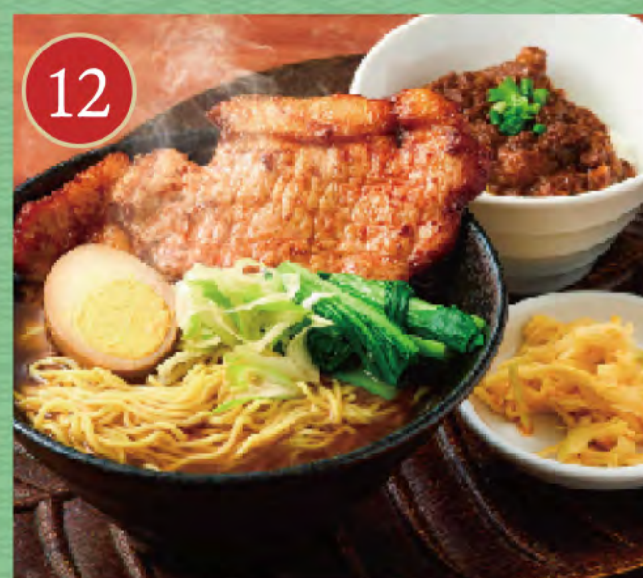
パイコー麺とミニ肉みそご飯