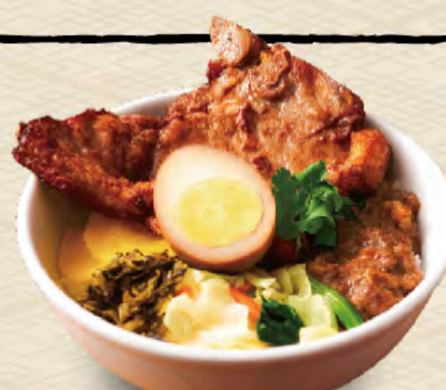
18 パイコー飯 (台湾式豚丼)