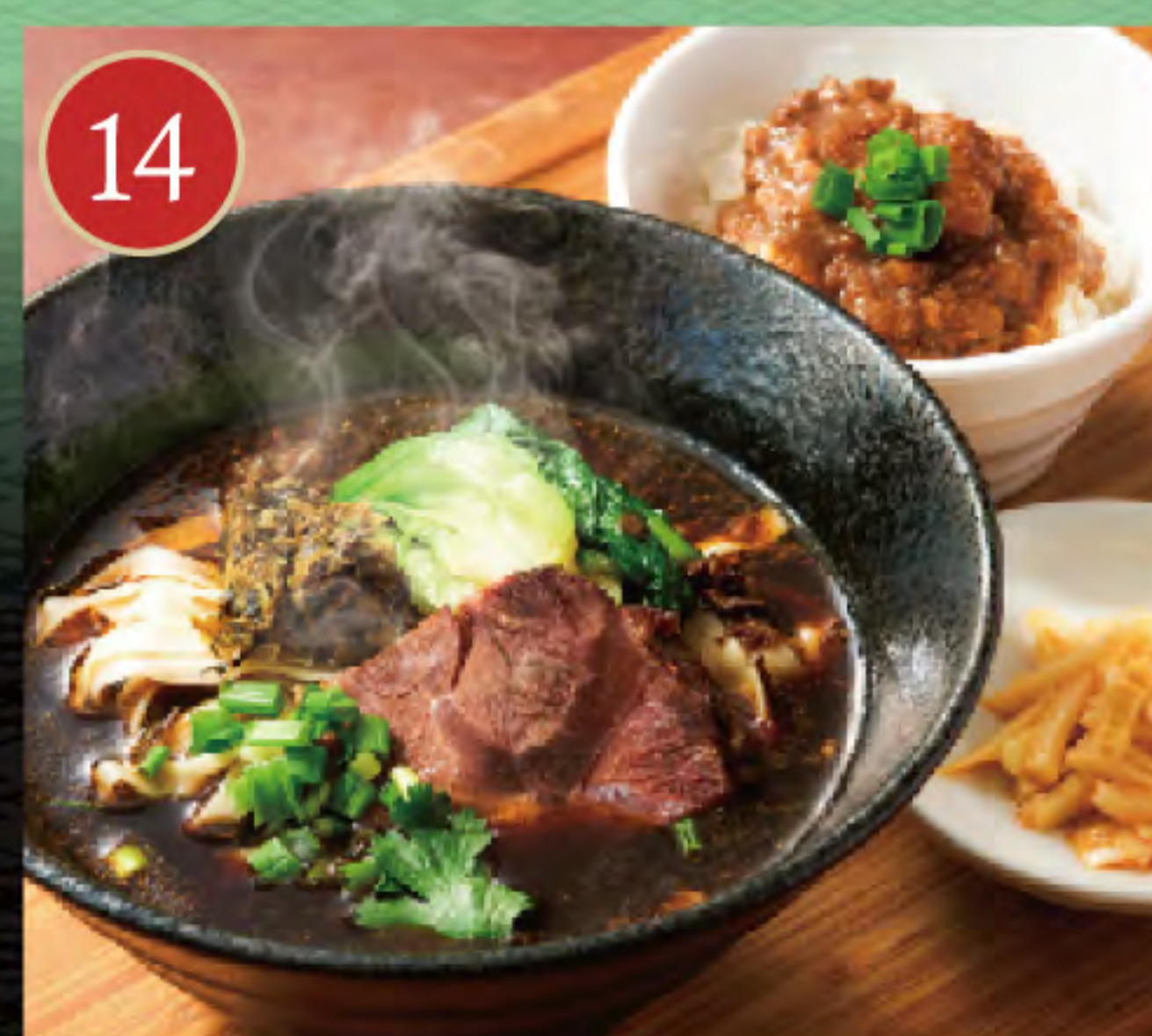
牛肉湯麺とミニ肉みそご飯