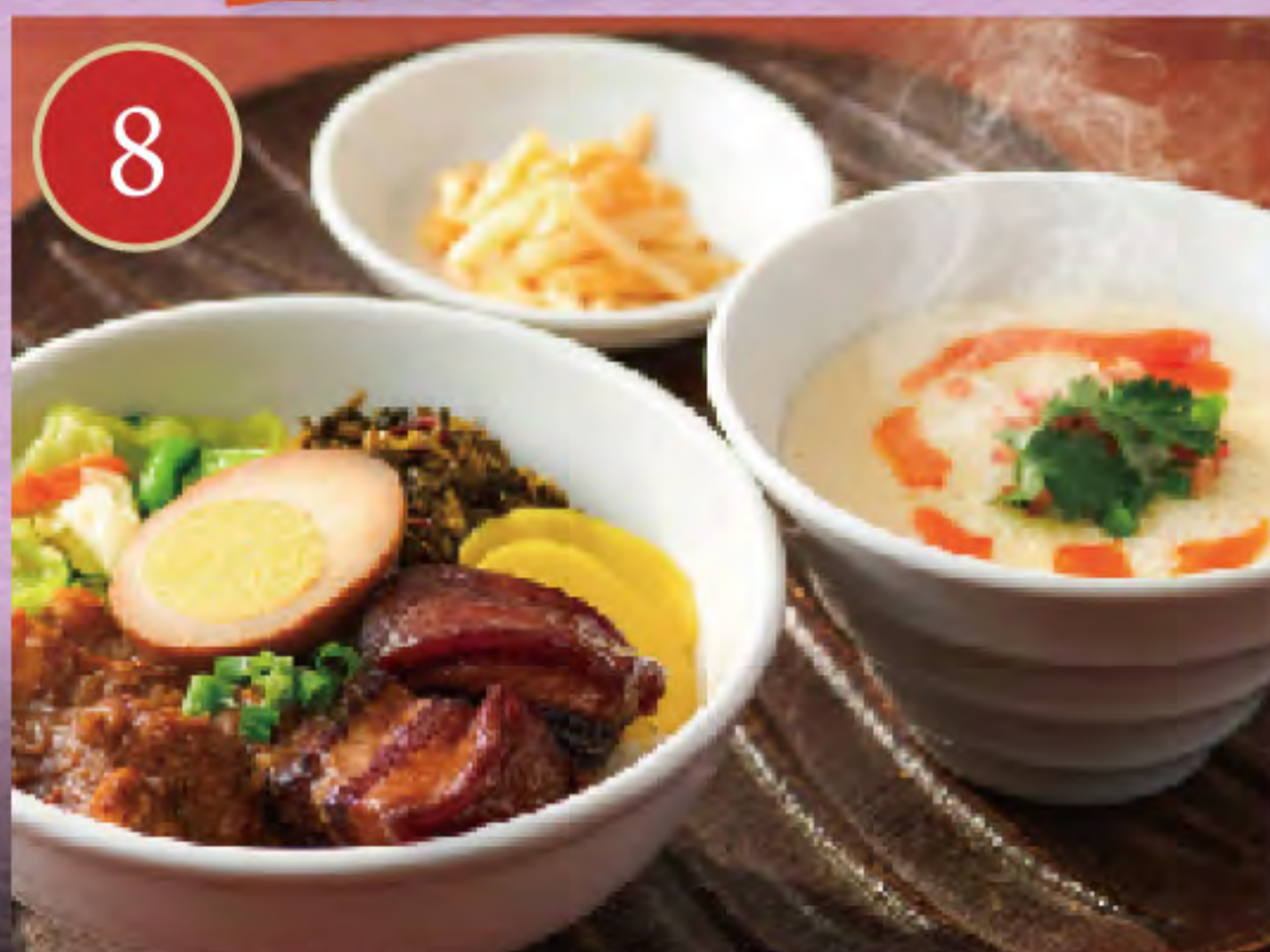
魯肉飯と鹹豆漿セット

干しエビとザーサイの旨味、ラー油の辛味が溶け合うふわとろ食感がおぼろ豆腐のような優しい味わい。