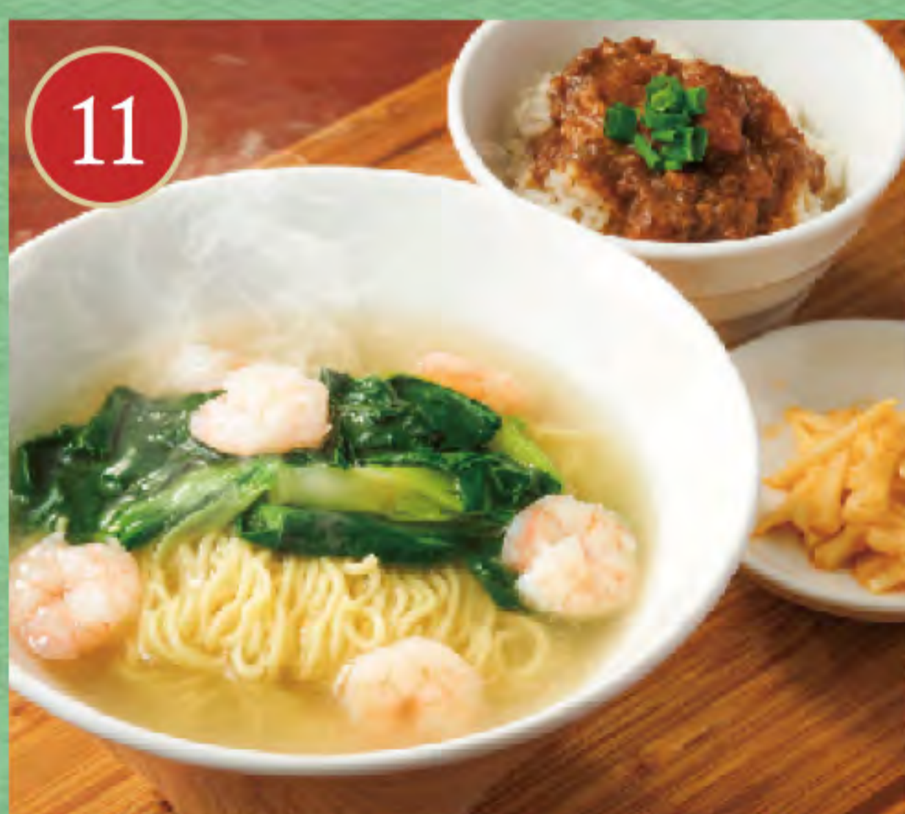
海老・青菜麺とミニ肉みそご飯セット